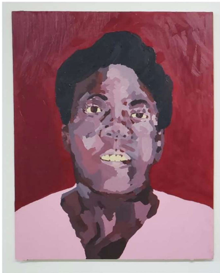
TITO CALAVERA JUANA COLÓN 2021 ÓLEO Y ACRÍLICO SOBRE MADERA 30" X 24" $2,000.00