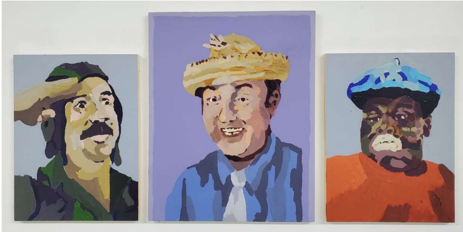
TITO CALAVERA JUAN MANUEL LEBRÓN 2020 ACRÍLICO SOBRE MADERA 16" X 12" $800