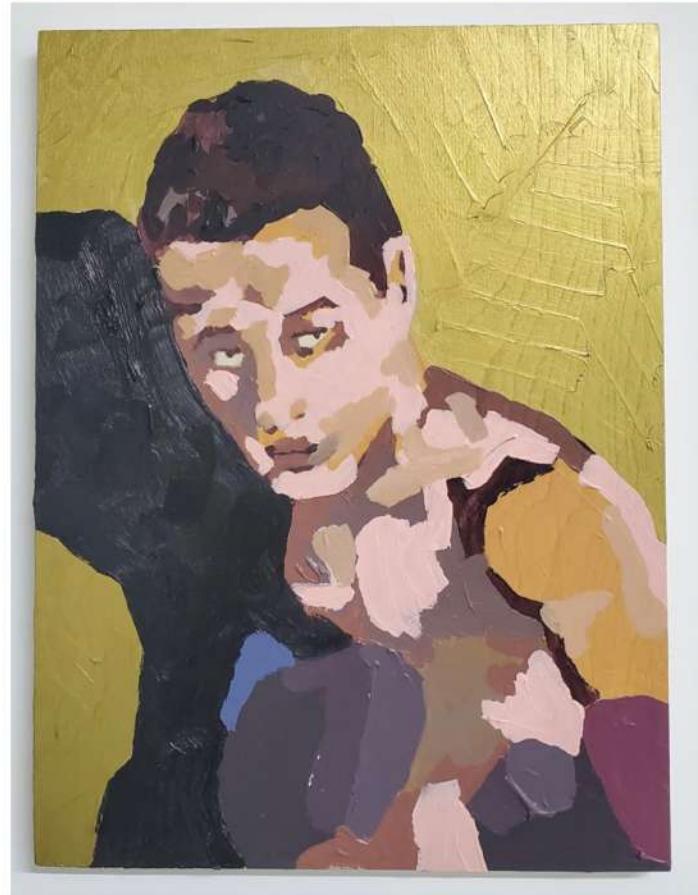
TITO CALAVERA SIXTO ESCOBAR 2021 ÓLEO Y ACRÍLICO SOBRE MADERA 16" X 12" $700.00