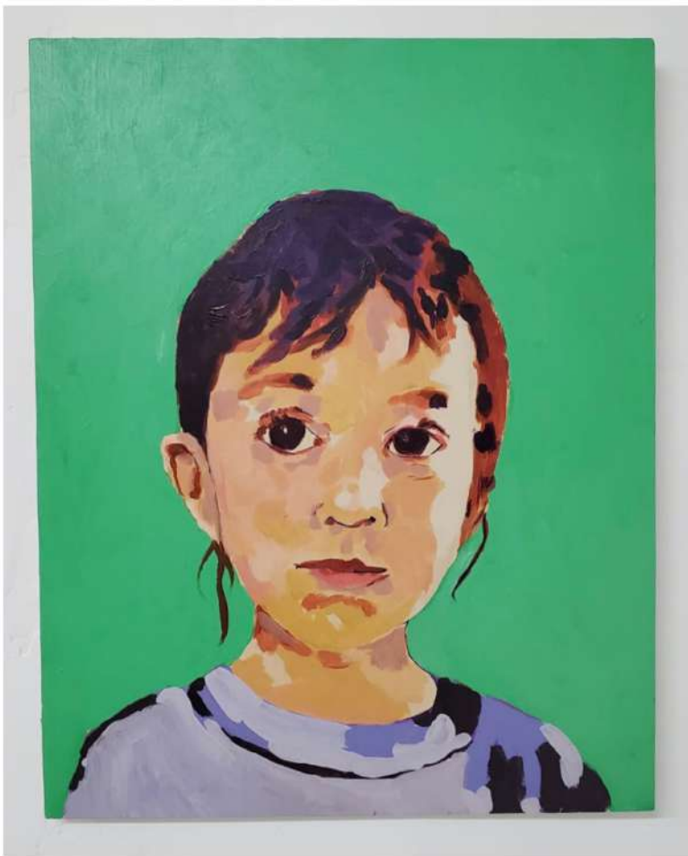
TITO CALAVERA IKER CALAVERA 2020 ACRÍLICO SOBRE MADERA 20" X 16" $800.00