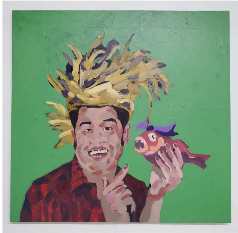
TITO CALAVERA TAVÍN PUMAREJO 2020 ACRÍLICO SOBRE MADERA 23.5" X 25" $800.00