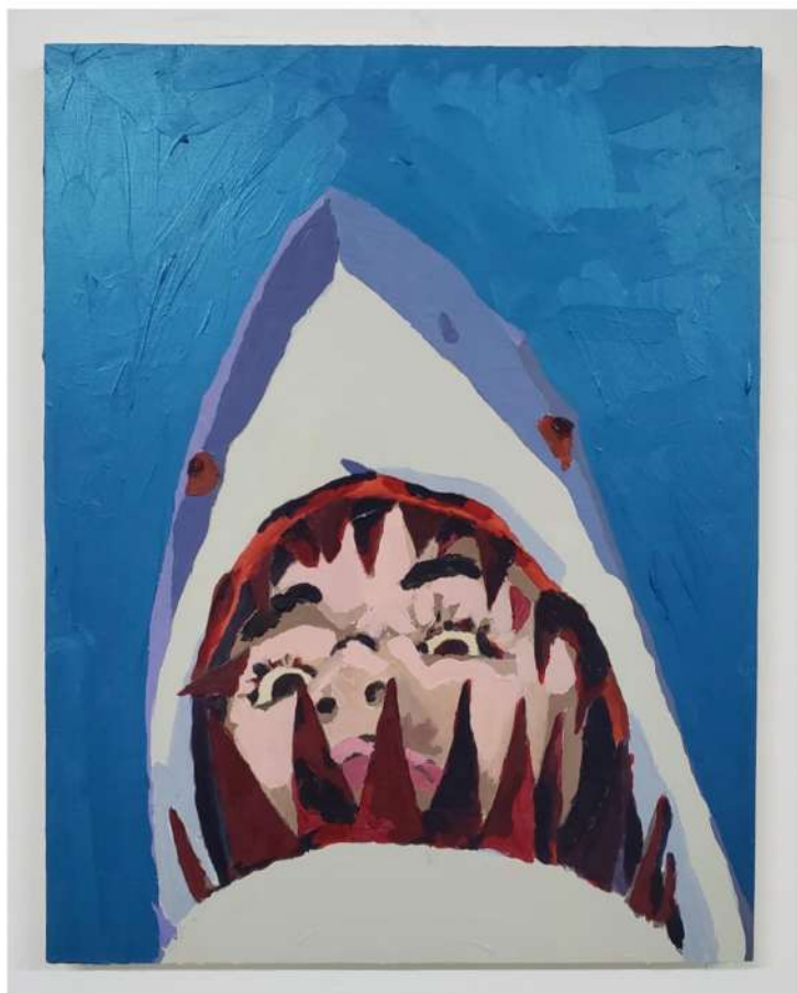
TITO CALAVERA VICTORIA TIBURONA 2021 ACRÍLICO SOBRE MADERA 16" X 12" $700.00