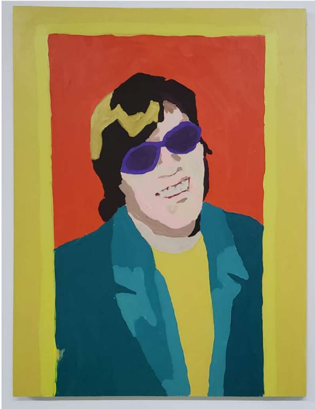
TITO CALAVERA JOSÉ FELICIANO 2020 ACRÍLICO SOBRE MADERA 20" X 16" $900.00