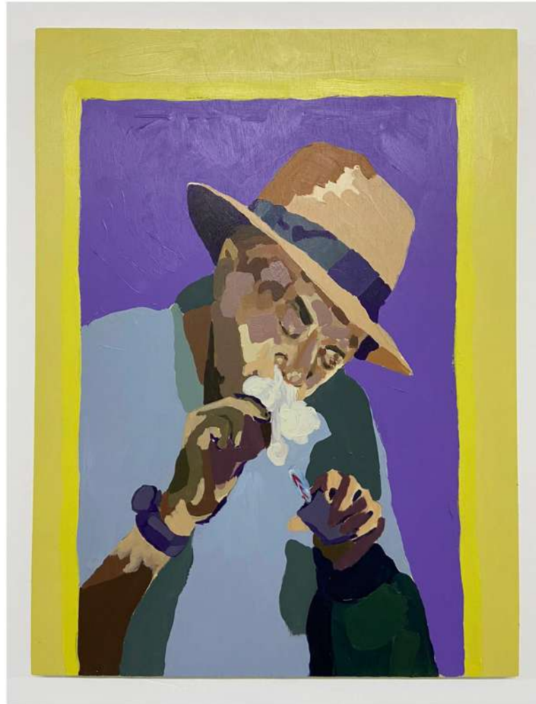
TITO CALAVERA YNOA 2020 ACRÍLICO SOBRE MADERA 20" X 16" $900.00