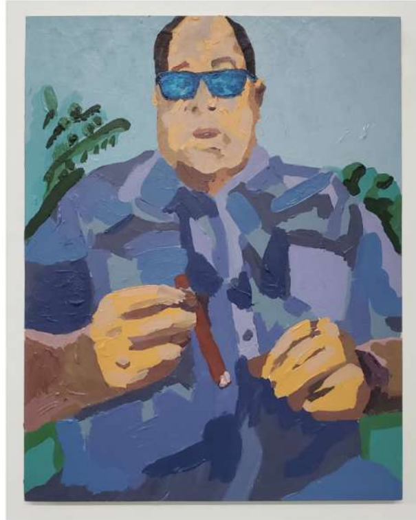
TITO CALAVERA SAMUEL 2020 ACRÍLICO SOBRE MADERA 18" X 14" $800.00