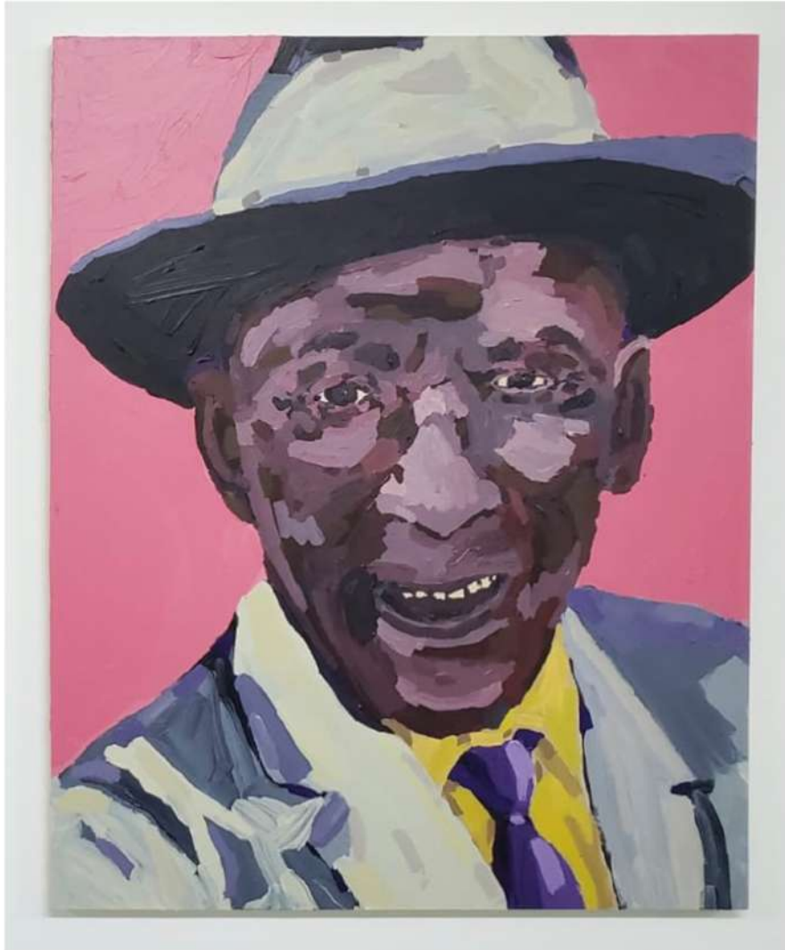
TITO CALAVERA EL JIBARITO INMORTAL "RAFAEL HERNÁNDEZ " 2021 ÓLEO Y ACRÍLICO SOBRE MADERA 30" X 24" $2,000.00