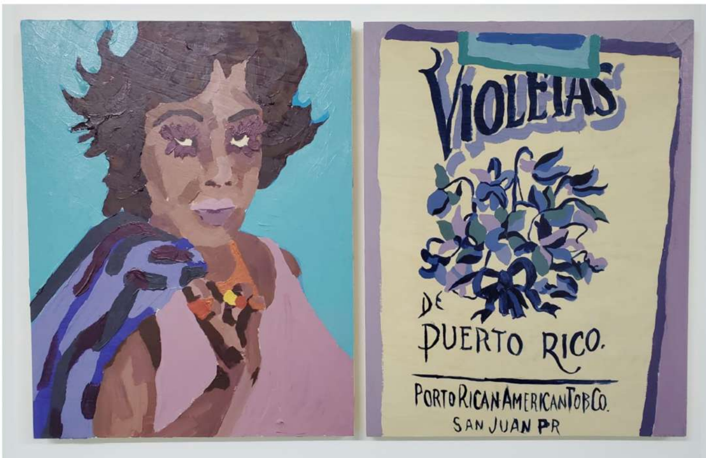
TITO CALAVERA LA LUPE 2020 ACRÍLICO SOBRE MADERA 20" X 16" $800.00