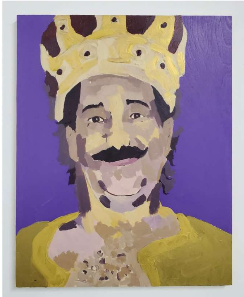
TITO CALAVERA CHICKY STARR 2020 ACRÍLICO SOBRE MADERA 20" X 16" $800.00