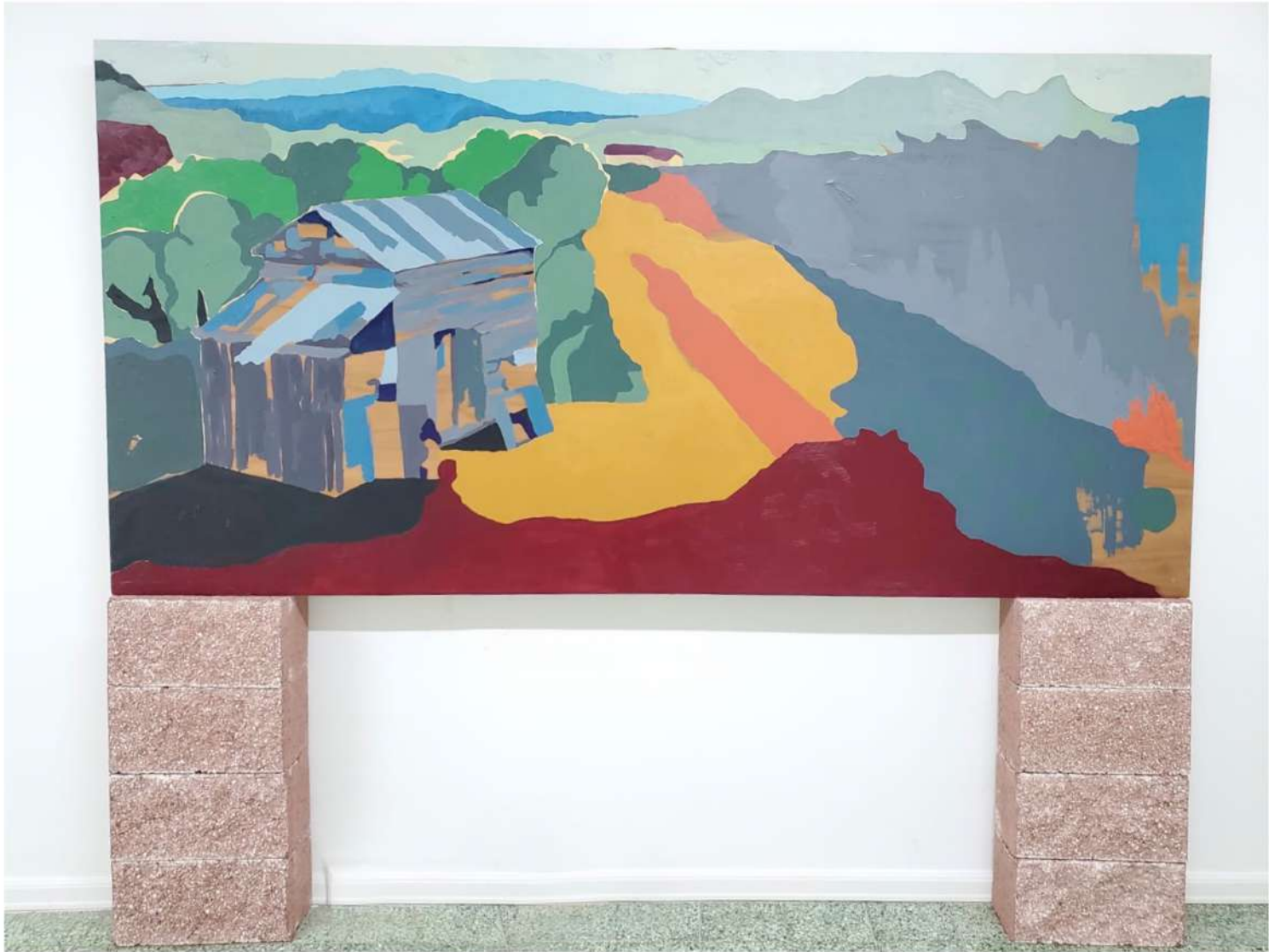
TITO CALAVERA CAYEY 2020 ÓLEO Y ACRÍLICO SOBRE MADERA 4' X 25' $4,000.00