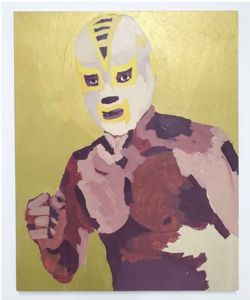
TITO CALAVERA EL INVADER 2020 ACRÍLICO SOBRE MADERA 20" X 216" $800.00