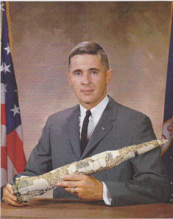
Astronaut William Anders (1967) mit Modell einer Saturn-V-Rakete.