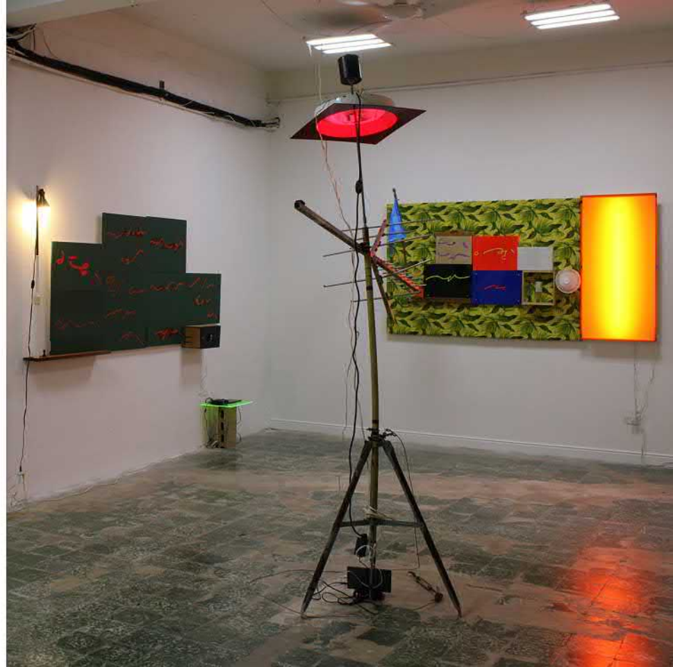
“el pinto” ensamblaje, antena de tv, lámpara fluorescente, plexiglass, sonido, dimensiones variables, 2022