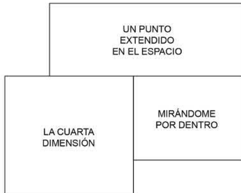
“en la del suspiro” ensamblaje, taquigráfica, pintura en aerosol, pintura de pizarra sobre madera, 46”x53.5”, 2023