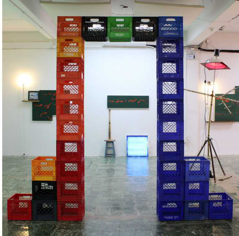
“arco de medio punto” ensamblaje, cajones de plástico para leche, dimensiones variables, 2022