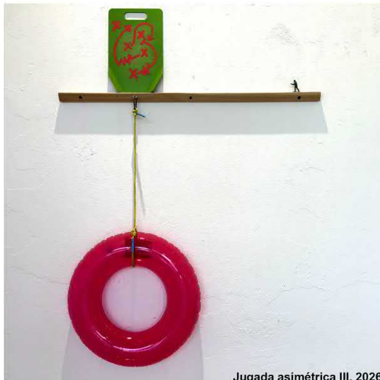
Jugada asimétrica III, 2026