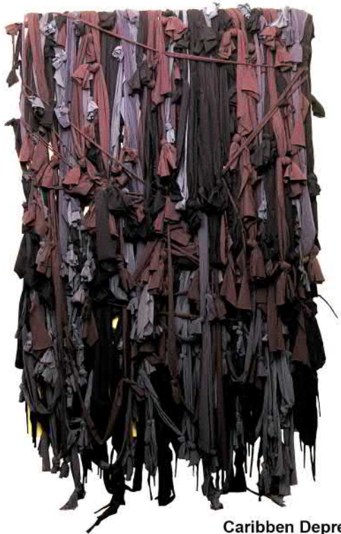
Caribbean Depression, 2013