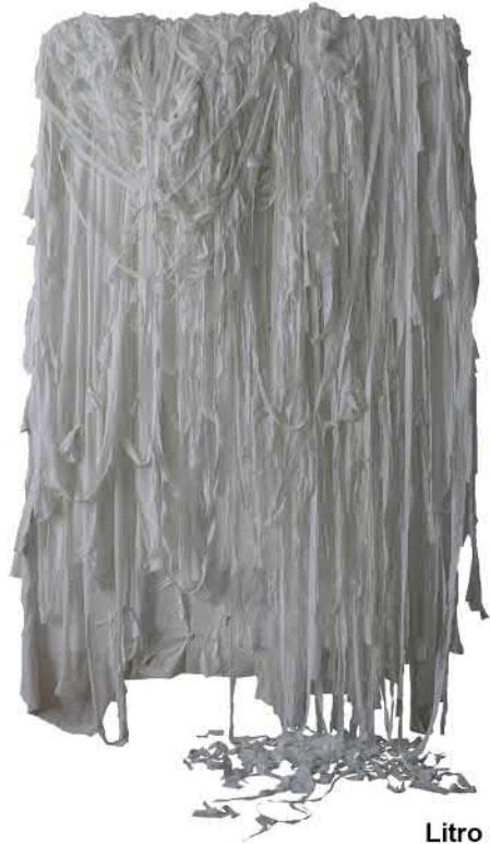
Litro de leche, 2013