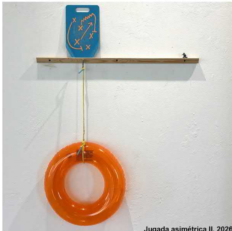
Jugada asimétrica II, 2026