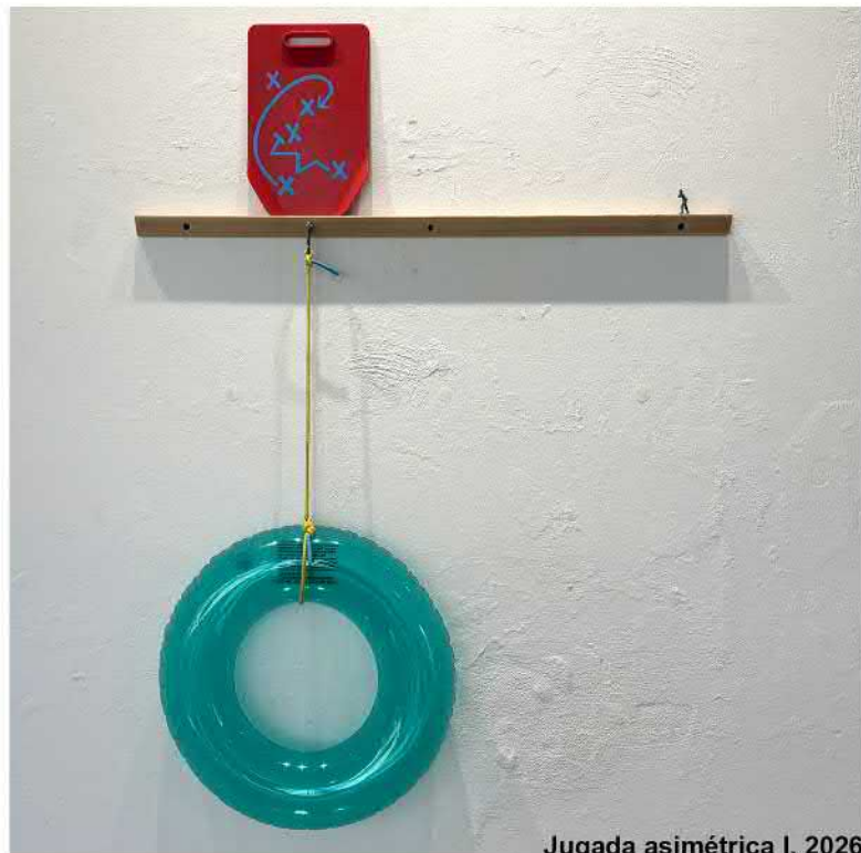
Jugada asimétrica I, 2026