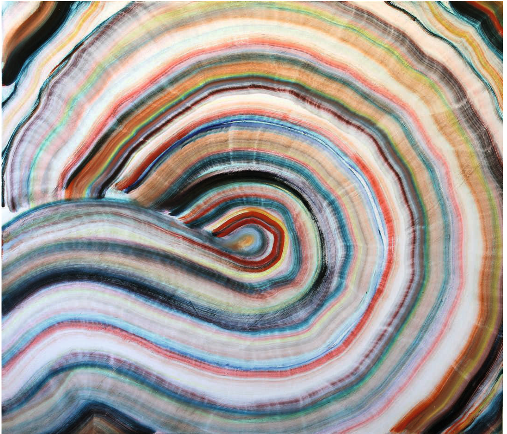
BOTICELLI BABY 2017 Huile sur toile 127 cm x 147 cm collection privée France