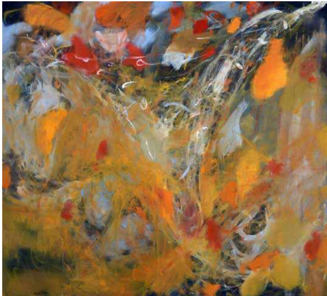
GOT YOUR GOOSE 2003 huile sur toile 92,2cm x 86 cm collection du Mrac Occitanie, Sérignan

Riede’s approach to her complex surfaces has obvious precedents in Abstract Expressionism and yet, unlike her Ab-Ex forebears, for whom the painterly mark pointed towards some timeless and universal utopian possibility, Riede’s self-expression—colorful, abstract vortices of paint pulsing with energy and vitality—never strays far from the here and now. Indeed, Riede’s paintings gesture to both the long and complicated history of abstraction and the individual artistic body in the present tense. And it is this improbable “both/and” aspect of her work, her painting’s palpable reminder of the long shadow of history on the one hand and the individual artistic gesture on the other, that makes looking at these visceral, energetic canvases so rewarding.