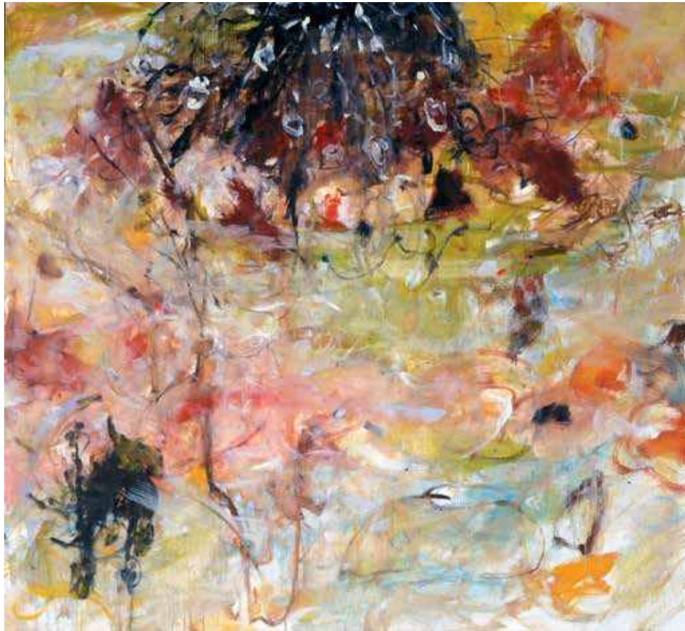
DUFFY 2003 huile sur toile 110cm x 120cm collection du Mrac Occitanie, Sérignan

Les peintures abstraites et vibrantes de Danielle Riede défient toute catégorisation. Ses surfaces picturales, colorées et résistantes, n'offrent que peu de répit à l'œil captivé du spectateur lorsqu'il parcourt ses toiles abstraites énergiques. Traduisant les rythmes de son corps en mouvement en tourbillons de peinture abstraits, l'artiste s'appuie sur ses années de formation en danse pour produire des compositions résolument non figuratives qui, paradoxalement, n'abandonnent jamais tout à fait la référence au figuratif et au corporel.