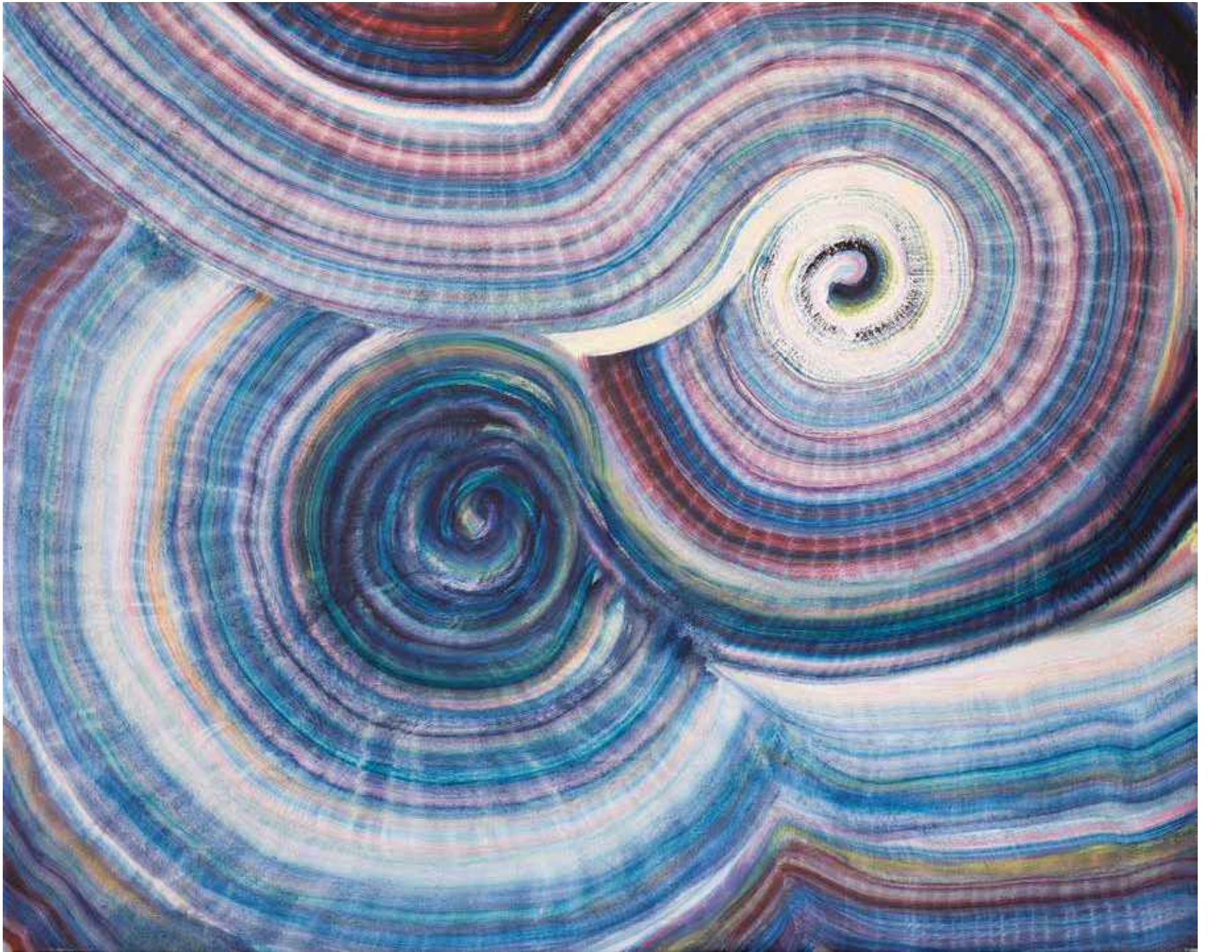
Jedes Universe 2020 huile sur toile 120 cm x151 cm collection privée Montaud France